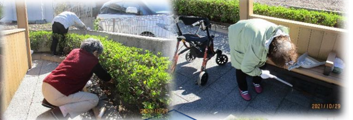
近隣の清掃活動に行ってきました！